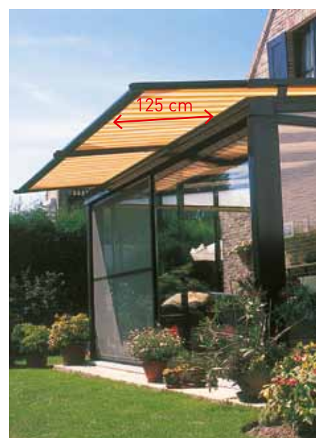
Une extension augmente considérablement l'ombre dans votre véranda.

Le store véranda B-126 est proposé avec une largeur maximale de 5m (10m en version couplé) et une avancée maximale de 6m.