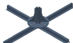
D : Maintien par dalles (option avec plus value)