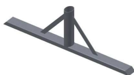
C : Pose au sol (option avec plus value)